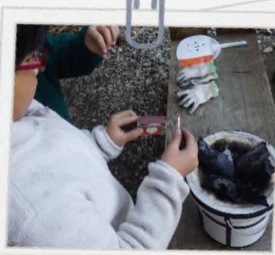
火ってどうやっておこす?冬の森で遊んだ後は、七輪でお昼ご飯を食べよう!