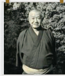
吉井勇の生涯を紹介します。